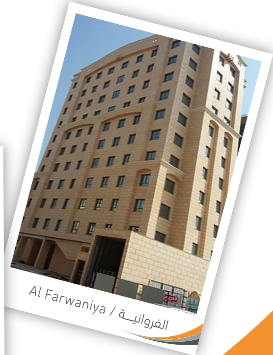
الفروانية / Al Farwaniya