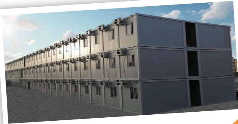
كبد / Kabd