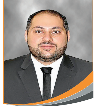
كلمة رئيس مجلس الإدارة Chairman Message

الالتزام بالمصداقية والإتيقان لنكون روادا في مجال التطوير العقاري , رابحين ونافعين بما يحقق أعلى مستويات الرضا لجميع الأطراف من خلال القيام بإدارة وصيانة العقارات والمشاريع باحتراف وتقديم مستوى متميز من الخدمات والمنتجات لعملائنا والمجتمع.