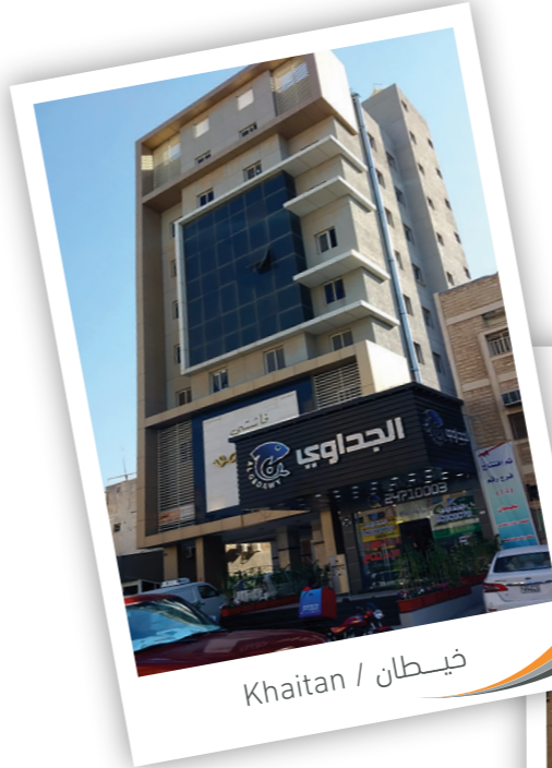
فيضان / Khaitan