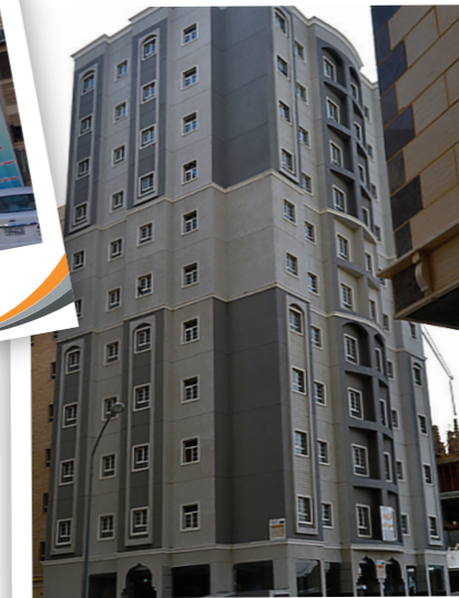
المهوبلة / Al Mahboula